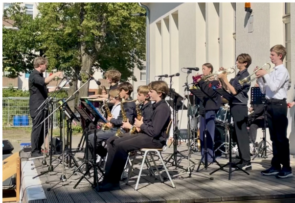
Die GHG Jazz Owlets bei der Reinickendorfer Bigband Night 2025

In den Owlets steht nicht nur das Einstudieren eines abwechslungsreichen Repertoires im Fokus, sondern vor allem die Entwicklung musikalischer Grundlagen: Jazztypische Phrasierung, ein sensibles Zusammenspiel innerhalb der Sections und das Gefühl für Stil und Timing werden intensiv geübt. Damit bereiten die Owlets ihre Mitglieder gezielt auf den nächsten Schritt vor – die Aufnahme in die GHG Jazz Owls, die etablierte Bigband der Schule.