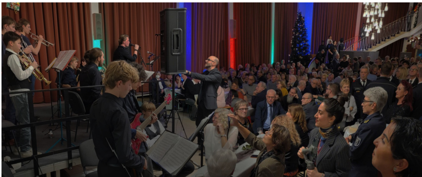
Foto: Auftritt im Foyer des Ernst-Reuter-Saals bei der Weihnachtsfeier des Bezirksamtes für die Ehrenamtlichen